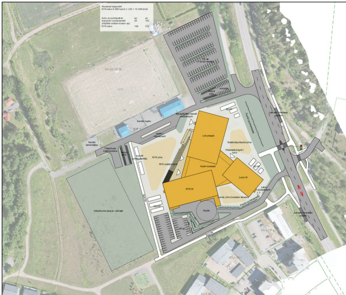
Kuva hankesuunnitelmasta, Lukkaroinen Arkkitehdit Oy, 4.12.2024