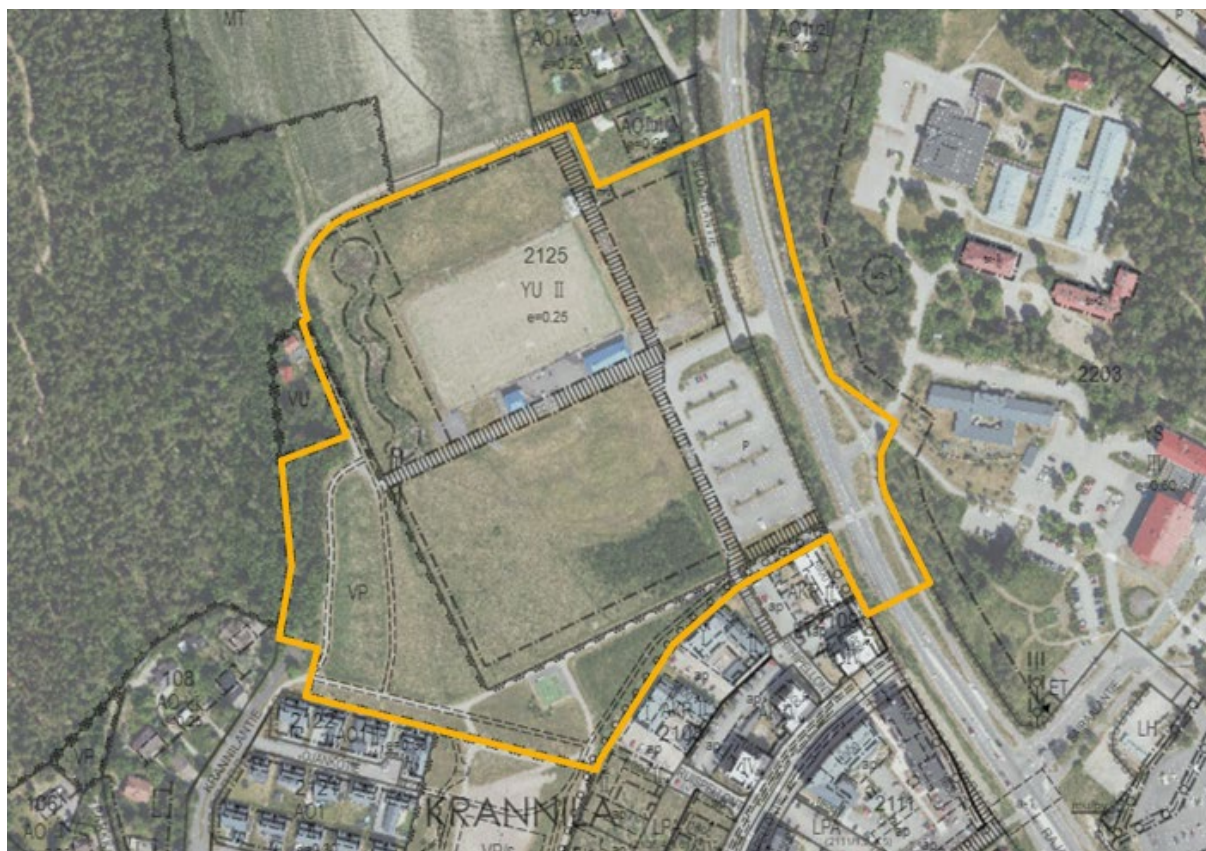
Ilmakuva ja ajantasakaava, kaavarajaus keltaisella.

Osallistumis- ja arviointisuunnitelmassa (OAS) esitetään, miksi asemakaava laaditaan, miten kaavoitus etenee ja missä vaiheessa siihen voi vaikuttaa. Osallistumis- ja arviointisuunnitelmaa täydennetään tarvittaessa kaavaprosessin edetessä. OAS on koko suunnitteluprosessin ajan Nurmijärven kunnan verkkosivuilla.