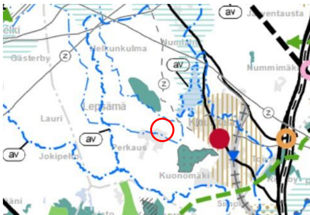
Kuva 1. Ote Uusimaa-kaava 2050:stä. Suunnittelualueen likimääräinen sijainti on osoitettu kartalla punaisella ympyrällä.

Klaukkalan 11.9.2017 voimaan tullut osayleiskaava määrittelee suunnittelualueen maa- ja metsätalousvaltaiseksi alueeksi (M-4). Alue on aivan osayleiskaavan mukaisen pientalovaltaisen asuntoalueen (AP-1) rajalla. Osayleiskaava ei ole tarkkarajainen aluevarauskaava, vaan rajaukset mahdollistavat joustoa asemakaavoja laadittaessa osayleiskaavan tavoitteita ja kaavaratkaisun periaatteita vaarantamatta. (kuva 2)