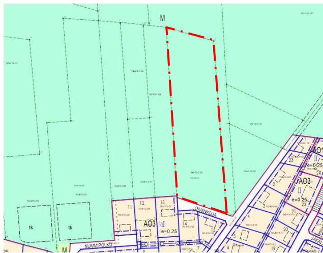
Kuva 3. Ote Lepsämän asemakaavasta. Suunnittelualue rajattu kartalle.

maatalousalueelle sekä istutettavalle rakennuspaikan osalle saa tehdä tarpeellisia kulkuteitä). Kaavoitettava alue rajautuu lounaassa AO3 -korttelialueeseen ja etelässä Oivankujan katualueeseen.