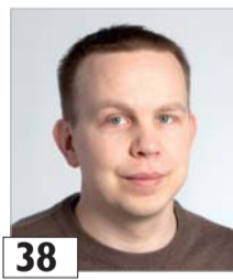
38 Tarikka Visa laskuttaja