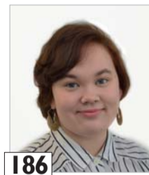
186 Huhta Kaisla opiskelija