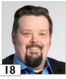
18 Manner Vesa autonkuljettaja