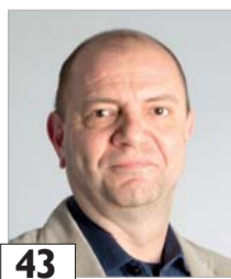
43 Vuorisalo Juhani rikosylikomisario