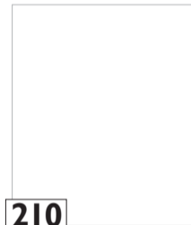
210 Turunen Pia opettaja, FM