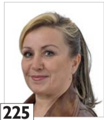
225 Hursti Lea sisustusteknikko