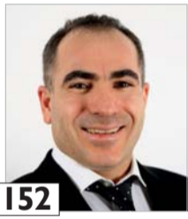
I52 Oral Nezir yrittäjä