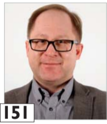
I51 Oksa Jari huoltisija