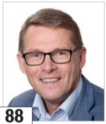
88 Vanhanen Matti kansanedustaja