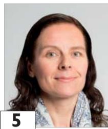
5 Horto Tarleena opettaja