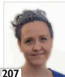
207 Siven Henna assistentti, liiketalouden tradenomi