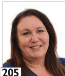
205 Salonen Nunu ostaja