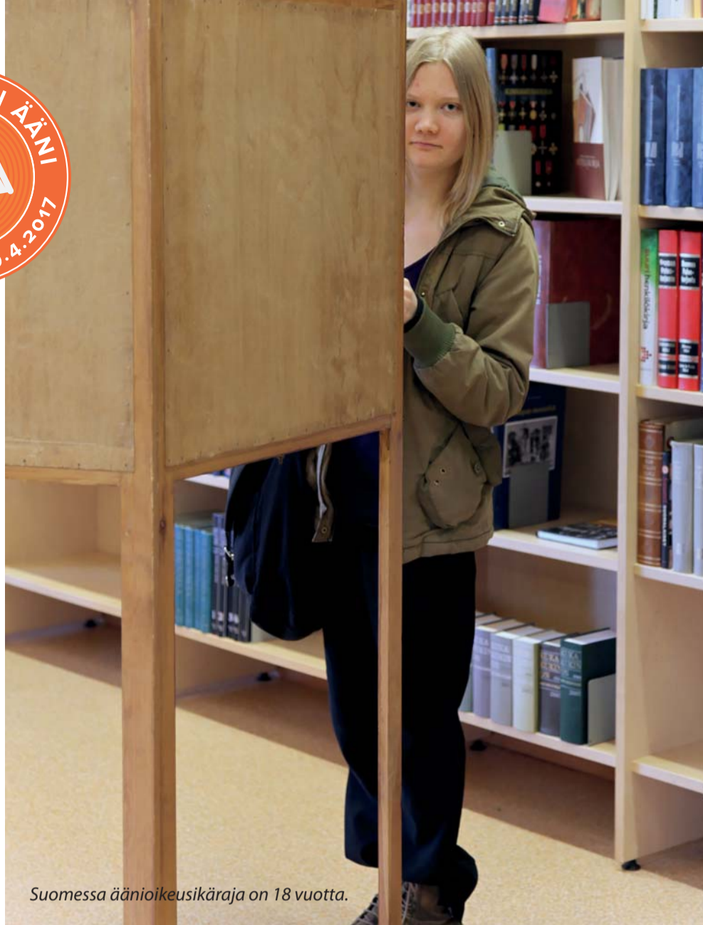
Suomessa äänioikeusikäraja on 18 vuotta.

Kotiäänestys toimitetaan jonakin ennakkoäänestysjaksoon (29.3.–4.4.2017) sattuvana päivänä kello 9:n ja 20:n välisenä aikana. Kotiäänestykseen ilmoittautuneelle ilmoitetaan ajankohta, jolloin vaalitoimitsija saapuu hänen luokseen. Kotiäänestyksessä on vaalitoimitsijan lisäksi oltava läsnä äänestäjän valitsema tai hyväksymä 18 vuotta täyttänyt henkilö, joka tässä tehtävässä ei toimi vaaliviranomaisen ominaisuudessa.