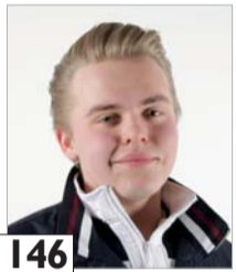
I46 Lepolahti Juhu opiskelija