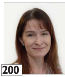
200 Pispala Leni erityisopettaja, KM