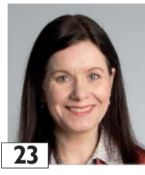
23 Mäkelä Outi KTM, kansanedustaja