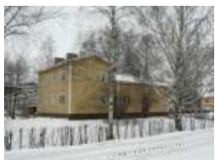
Kaakkoissivu Pratikankujan varrella v. 2009