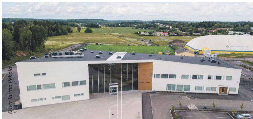
Päivän aikana on mahdollista tutustua myös Monikossa toimivien opistojen toimintaan.

Myynti- ja esittelypisteet ovat kooltaan 4 x 4 m 2 . Esittelijät/myyjät tuovat itse tarvitsemansa rekvisiitan. Myynti- ja esittelypisteiden hinta on 50 €. Paikallisille nuorisotoimintaan liittyville yhdistyksille paikat ovat