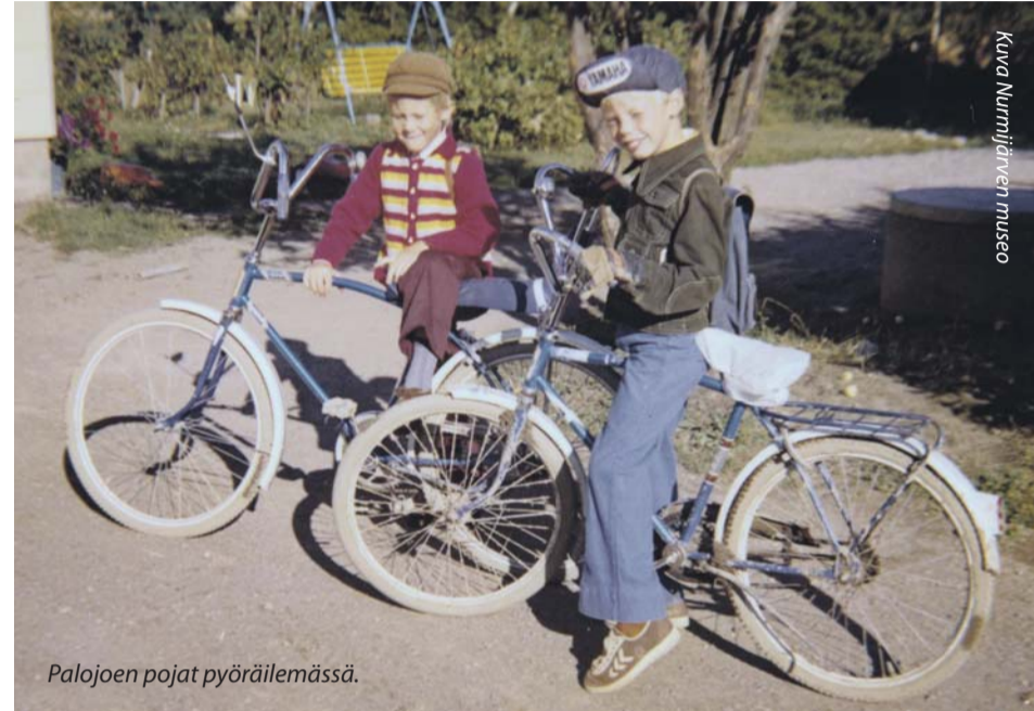
Palojoen pojat pyöräilemässä.

Millaista oli lapsuus ennen kännyköitä? Oletko leikkinyt Kirkkonrottaa, Tervapataa tai Seinäpallaa? Onko Noppa-Noppa tv-ohjelma sinulle tuttu? Muistatko vielä ensimmäiset Pikku Kakkosen lähetykset? Entä sitkeät merirosvorahat, "merkkarit"? Hyvinkään kaupunginmuseon, Järvenpään taidemuseon, Keravan museon, Mäntsälän museotoimen, Nurmijärven museon ja Tuusulan museon "Markalla merkkareita"-yhteistyöhankkeessa on laadittu nykylapsille suunnattu opetuspaketti, jossa kerrotaan lapsuudesta 1970-luvulla.