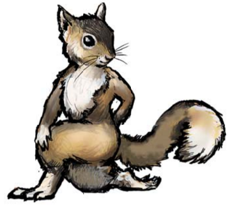
Ketterät Kaverit -joogakorteissa liikkeitä havainnollistavat monenlaiset eläimet alligaattorista oravaan, leijonasta laiskaiseen.

Tällä hetkellä kortit ovat käytössä varhaiskasvatuksessa ja syksyn aikana joogakortit hankitaan myös alakouluihin ainakin alkuopetuksen ja liikunnanopetuksen käyttöön.