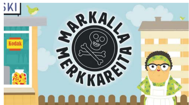
1970-luvun lapsuus tulee tutuksi osoitteessa www.markallamerkkareita.fi .

"Markalla merkkareita"-sivustoon voi tutustua osoitteessa www.markallamerkkareita.fi . Sivuilta löytyvät myös tarkemmat ohjeet laukun lainaamiseen.