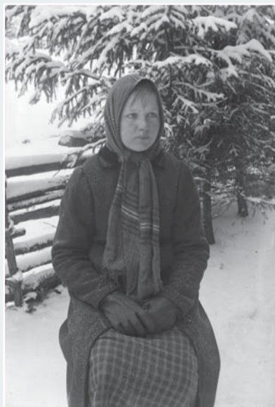
Klaukkalan myllärin tytär kuvattavana.

Nuoren tasavallan kansalaisia -valokuvanäyttelyssä nähdään muotokuvia itsenäisyyden alkuvuosien nurmijärveläisistä. Yksi keskeinen kuvaaja on klaukkalainen kyläkuvaaja Elias Sirenus, joka otti useita satoja valokuvia lähiseudun asukkaista 1910- ja 1920-luvuilla.