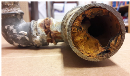
Yli 50 vuotta vanhat vesijohdot voivat kasvaa lähes umpeen ja heikentää veden laatua.

Kiinteistön ja vesihuoltolaitoksen vastuuraaja on vesijohtoverkon osalta runkovesijohdossa. Jätevesi- ja hulevesiverkoston osalta vastuuraaja on runkoviemärisissä tai liitoskaivossa. Myös kellari-tilojen padotusventtiili tai pumppaamo on kiinteistön vastuulla. Jos padotuskorkeuden alapuolisiin tiloihin tulvii viemäriä, tulvasta aiheutuneet vahingot ovat kiinteistön omalla vastuulla.