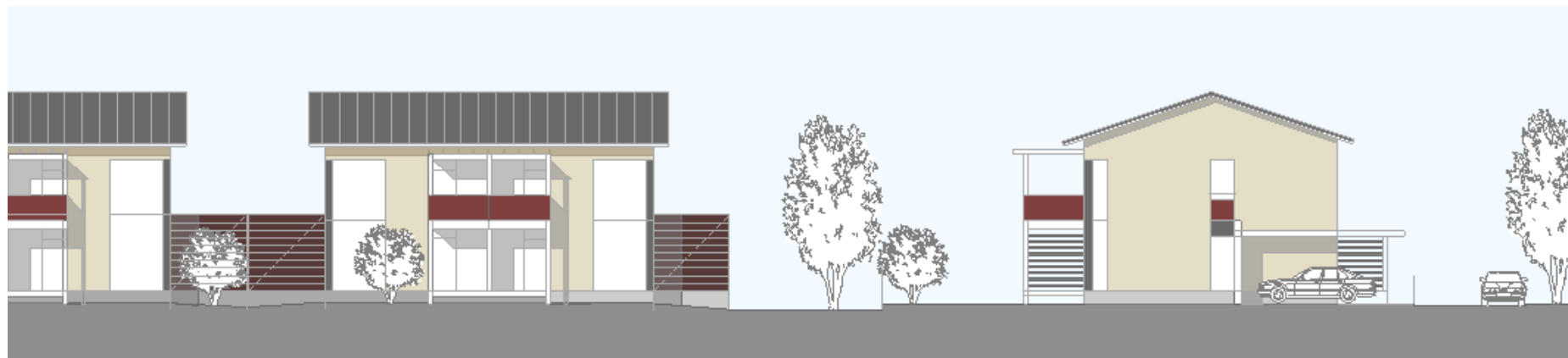
Havainnekuva pihapiiristä leikkauskuvan muodossa.