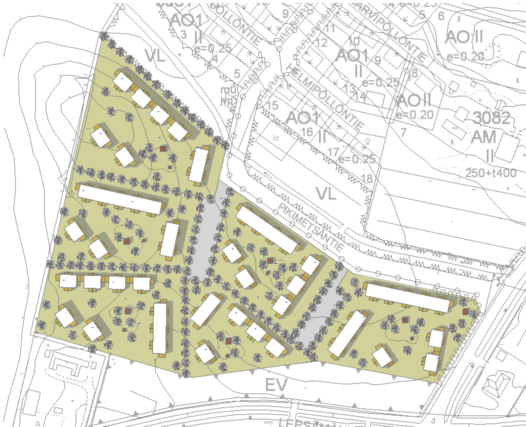
Eteläinen alue havainnekuvana. Korttelit aukeavat etelään ja länteen. Itä-pohjoispuoli on suljettu rakennusryhmin.