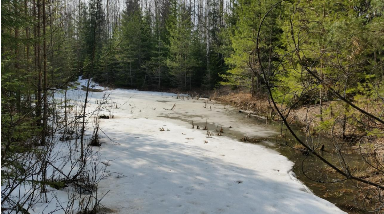
Kuva 3. Läntisempi lammikko huhtikuun alussa.