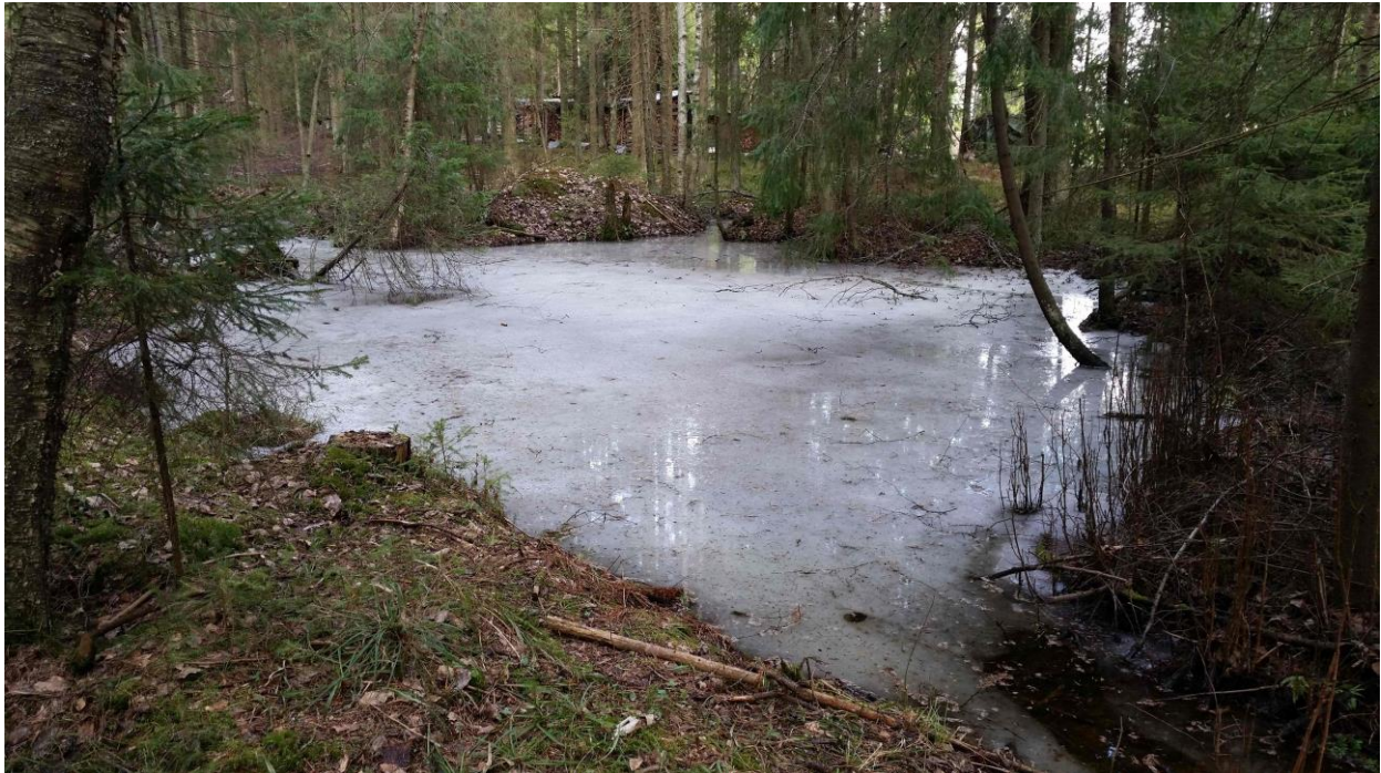
Kuva 2. Itäisempi lammikko huhtikuun alussa.

Tulosten perusteella liito-orava ja viitasammakko eivät esiinny selvitysalueella, joten niitä ei tarvitse erityisesti huomioida asemakaavassa. Suositusten antamiselle ei ole tarvetta.