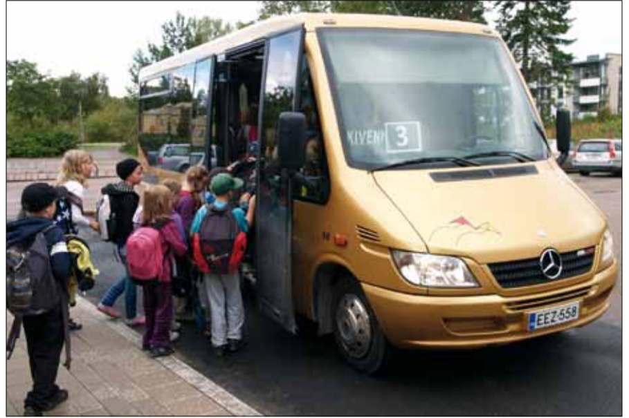
Kivenkyydin liityntälinjoilla kulkee runsaasti myös koululaisia. Tässä noudetaan kotiin lähteviä alakoululaisia Lukkarin koululta.

Ennen aamuyhdeksää ja iltapäivän kolmen jälkeen ajetaan ns. liityntälinjoja, joita