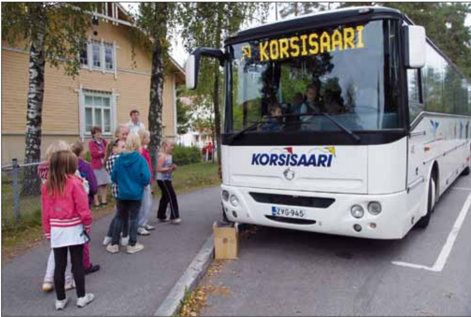
Kampanjan ensimmäinen tilaisuus oli Rajamäen koululla. Se järjestettiin aktiivisesti toimivan Rajamäen Koti ja Koulu ry:n aloitteesta jo ennen varsinaista kampanjaviikkoa 8. syyskuuta.

N urmijärvellä on käynnissä ainutlaatuisen joukkoliikenteen koulukampanja, jonka toteuttaa Nurmijärvilippu-työryhmä. Liikennekasvatusviikolla 13.-17. syyskuuta tavoitettiin lähes kaikki ekaluokkalaisten, joille valistusta levitettiin näytelmän sekä viihteen keinoin.